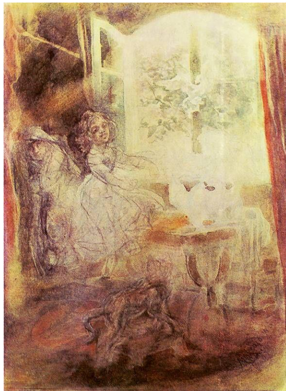
„Dziewczynka przy oknie” Cyprian Kamil Norwid, 1821-1883