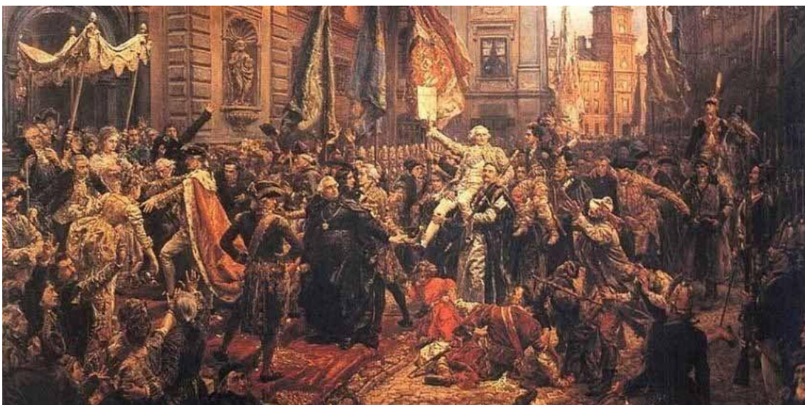
Uchwalenie Konstytucji 3 Maja, Jan Matejko